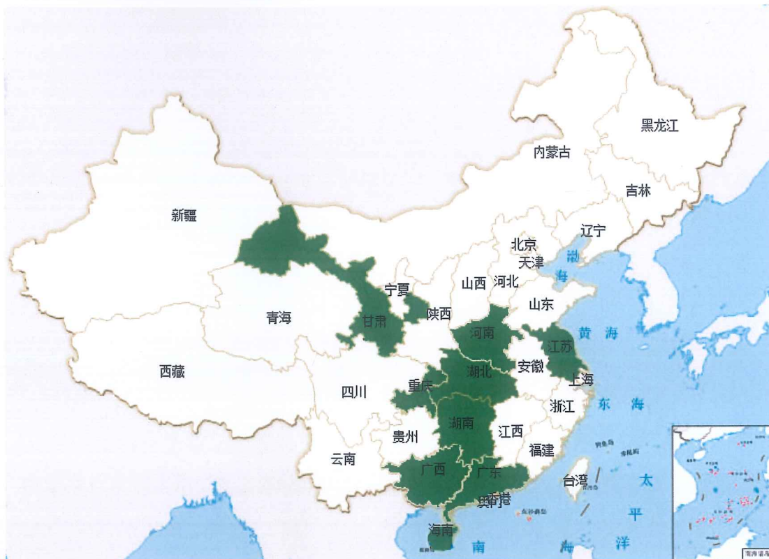
图 1 募投绿色项目区域分布图

募集资金用途同时遵循《GBP 原则》，募投项目分别属于可持续水资源与废水管理、生物资源和土地资源的环境可持续管理、可再生能源三大类别。